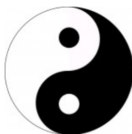
Symbol jin - jangu

Vše se řídí zákonem Jin/Jang . Horko jednou vychladne, léto se promění v zimu, a dokonce i to nejsilnější mládí uvadne ve stáří. Tak má vše svého přirozeného protihráče, který se stará o to, aby řád zůstal zachován v nekonečném koloběhu.