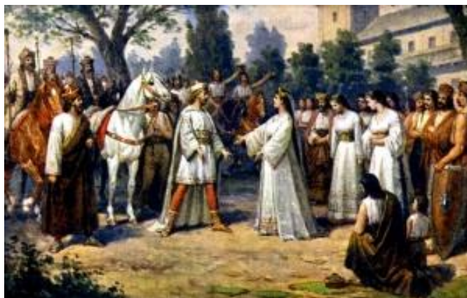
Kněžna Libuše vítá Přemysla na Vyšehradě

Když se blížili k Vyšehradu, Libuše už Přemysla vyhlížela. Svatba se slavila nejen na hradě, ale i v podhradí.