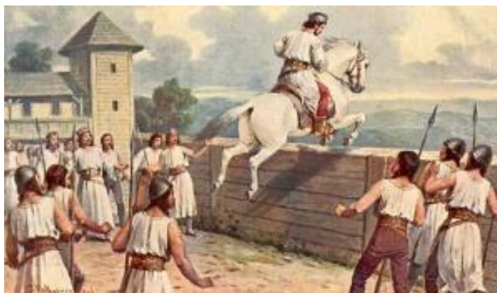
Horymír se Šemíkem překonávají Vyšehradské hradby

Všichni se za Horymíra přimlouvali a Křesomysl mu nakonec odpustil.