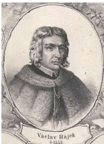
Václav Hájek z Libočan