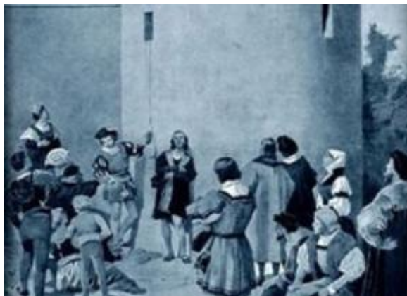
Dalibor si ve vězení vydělává na obživu hrou na housle