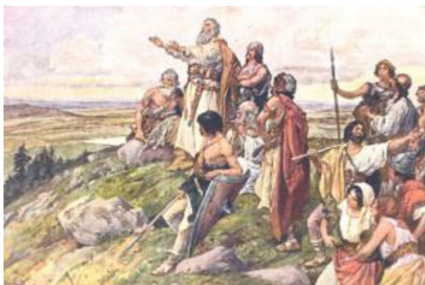
Praotec Čech na Řípu ???

Zemi chybělo jen jméno. Jeden stařešina rozhodl, že by se měla jmenovat dle Čecha – Čechy.