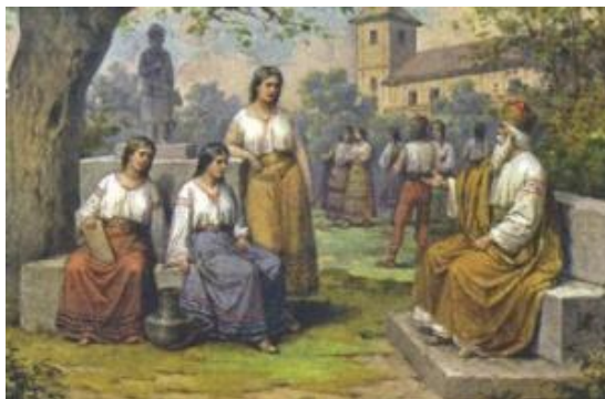
Vojvoda Krok se svými dcerami na Vyšehradě

Stařešinové a vladykové se domluvili, že vládnout bude Libuše. Mladá kněžna měla svůj hrad nazvaný Libušín, ale sídlila na Vyšehradě, odkud moudře a spravedlivě vládla.