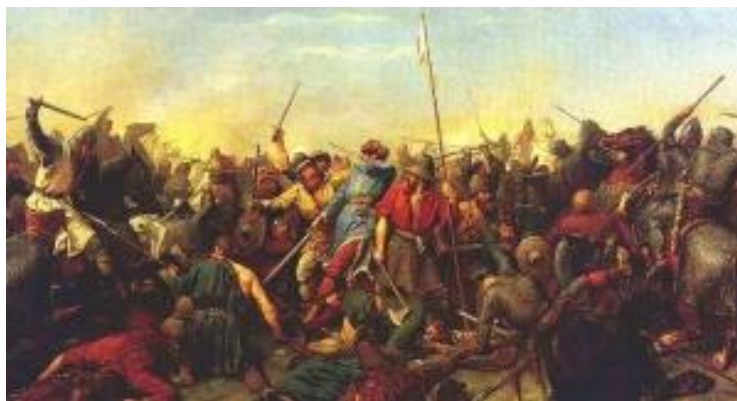
Lucká válka – Bitva na Tursku

Když dojel domů, čekalo ho nemilé překvapení. Jeho žena byla mrtvá. Když jí odhrnul vlasy, zjistil, že nemá uši. Vytáhl ty, které uřezal prvnímu Čechovi, který se na něj hnal. Tím, kdo ho chtěl zabít byla jeho žena.