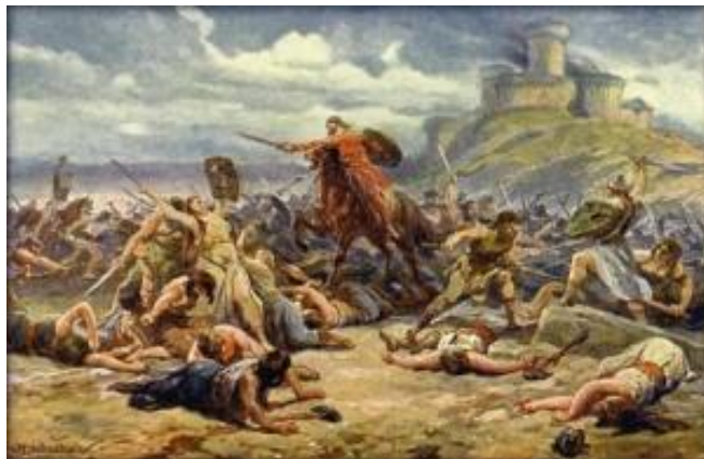
Dívčí válka – v pozadí hrad Děvín

Vlasta jela s ostatními zatčené dívky vysvobodit a Vyšehrad dobýt. Než však dorazily k hradbám, muži už se hnali proti nim. Mnoho dívek v tomto boji padlo. Mezi nimi i Vlasta. Potom muži vypálili Děvín a v zemi nastal klid.