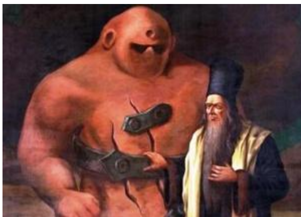
Golem a jeho stvořitel - rabín Löw

Rabín poznal, jak může být Golem nebezpečný a rozhodl se, že ho zbaví života.