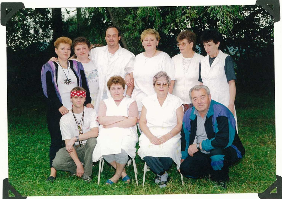
Alk 8 éves