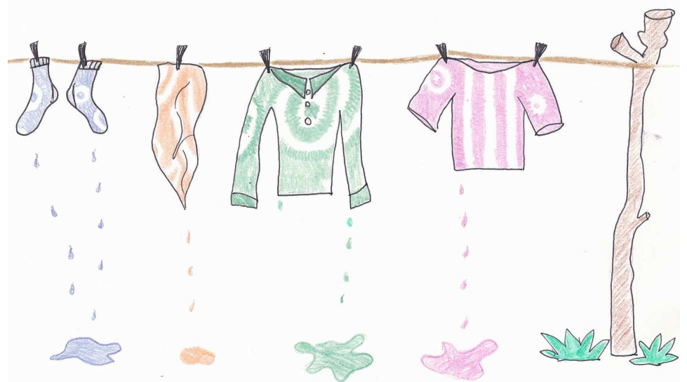
Na letošním táboře jsme: